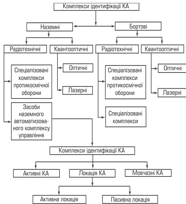
Рис. 1. Класифікація комплексів ідентифікації КА

За таких умов одне з головних завдань ідентифікації — якнайповніше використати здобуту інформацію.