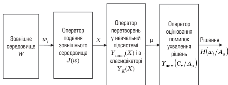
Рис. 2. Узагальнена модель РТСР

де J(w_i) — оператор подання (опису) зовнішнього середовища; Y_{\text{навч}}(X), Y_K(X) — оператор відповідно перетворення в навчальній підсистемі та класифікаторі; Y_{\text{пом}}(C_r/A_\mu) — оператор оцінювання помилок ухвалення рішень.